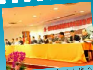
與中正大學合作舉辦學術研討會