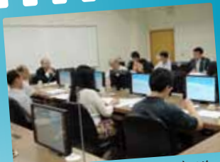
召開犯罪研究諮詢會議