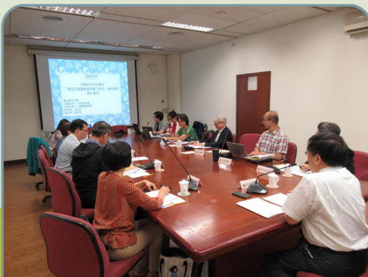
「建立被害資料庫 之研究」