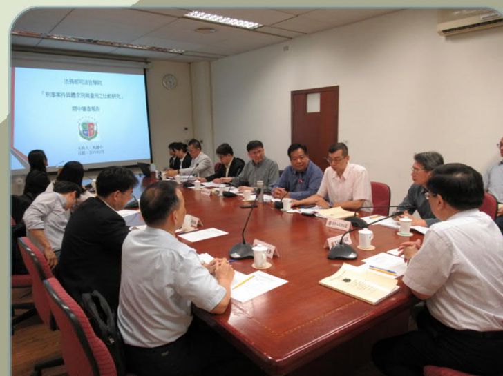
「刑事案件具體求刑 與量刑之比較研究」