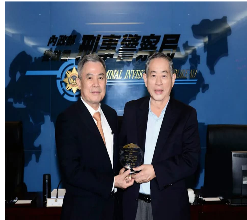
2021年5月6日智冠科技協助打擊詐騙獲獎肯定。