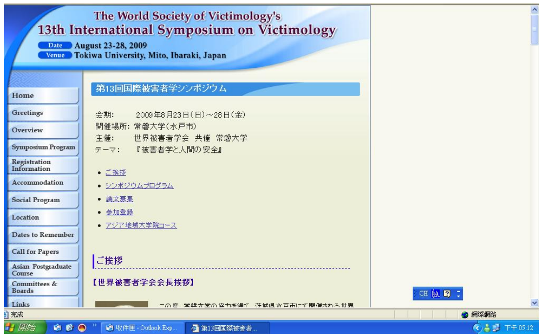
圖表 2 世界受害者學學會 WSV 資料（一）

觀察 2009 年世界受害者學學會（WSV）年會之主要研究趨向議題介紹，可客觀查知當前國際受害者學趨向。參考下圖資料中，可發現當前世界受害者學研究主要以九項議題為主，分別為「受害者學與人的安全」、「受害者人權條約（Victim Convention）與國際法、國內法」、「難民被害、聯合國難民高等辯務